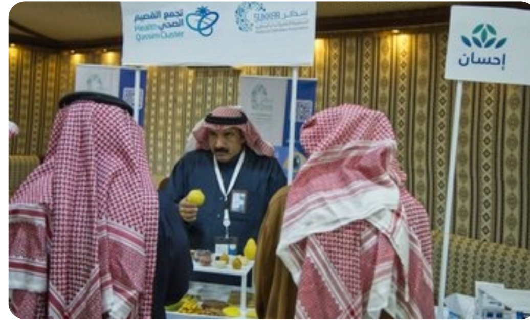
مركز البتراء بمحافظة #النبهانية بـ #القصيم