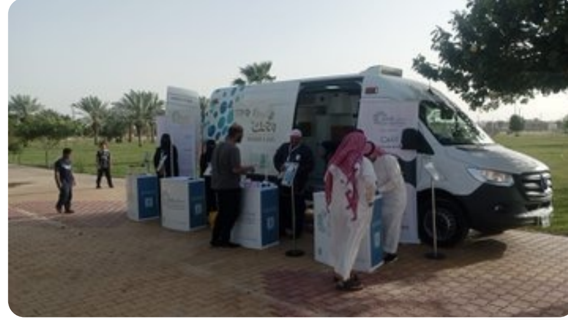
مضمار حديقة الرفيعة