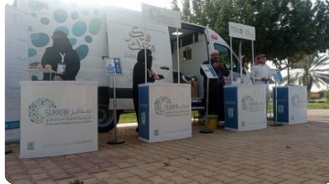
مضمار حديقة الرحاب