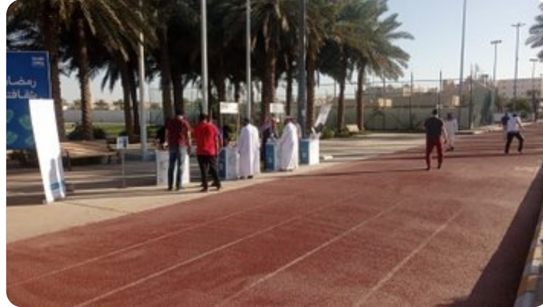
مضمار حديقة العقيلت