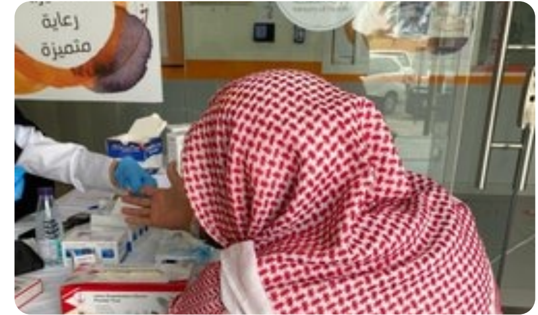
مركز المرموثة بمحافظة #النبهانية بـ القصيم