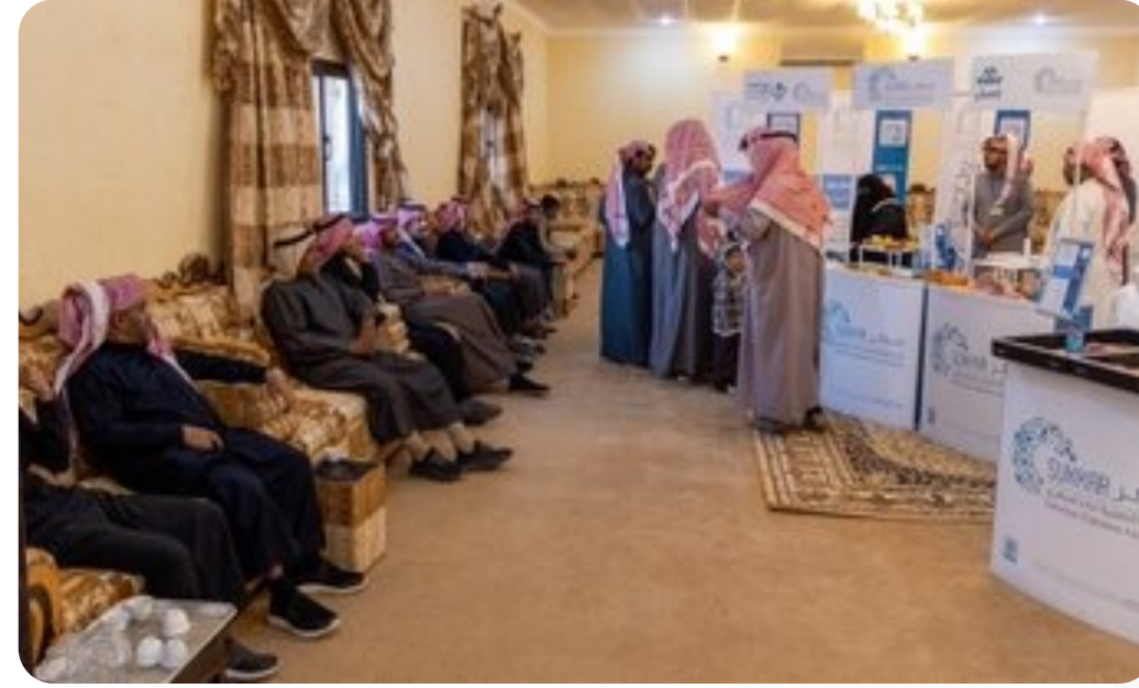
مركز النمرية بمحافظة #رياض_الخبراء بـ #القصيم