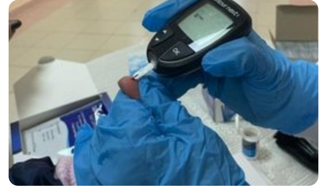
ضمن جولة الجمعية «القرى النائية»، بشري